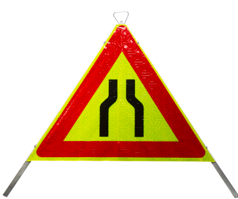
Foldeskilt MS, komplett, skilt 106.1 (41612000110)

Foldeskiltene leveres med klasse 3 fluorescerende refleks (garantitid på 12 år i hht HB R310), etui for oppbevaring og lodd for å holde skiltet på plass selv når trailerne suser forbi. Etter endt bruk klappes skiltet sammen og legges i etuiet som følger med. Dette gjør at skiltene tar liten plass ved oppbevaring og transport.