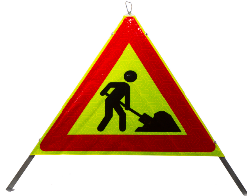
Foldeskilt MS, komplett, skilt 110 (41612000156)