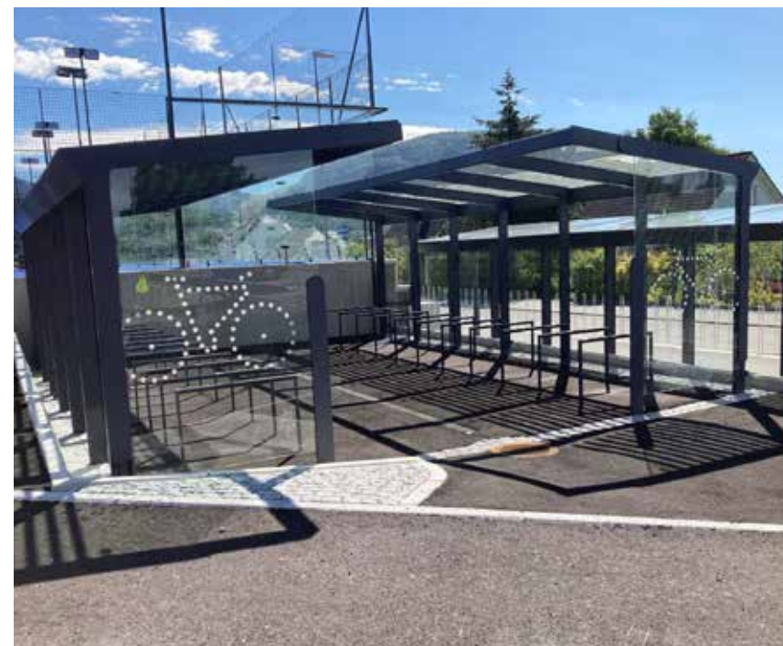
Aureo Velo sykkeloverdekning, Jørpeland i Rogaland