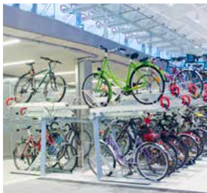
Easylift Premium DIN 500 sykkelparkering