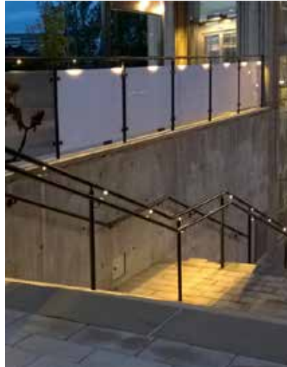
Opti rekkverk med LED-lys