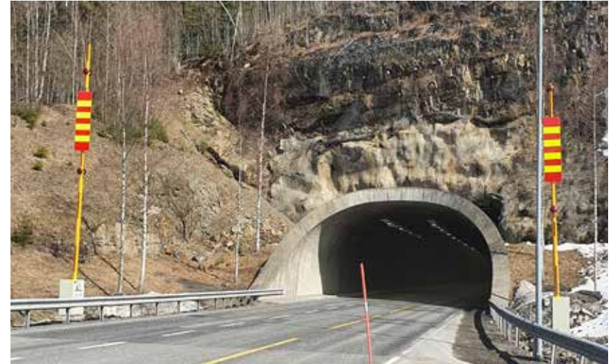
Rusthoven elektrisk bom