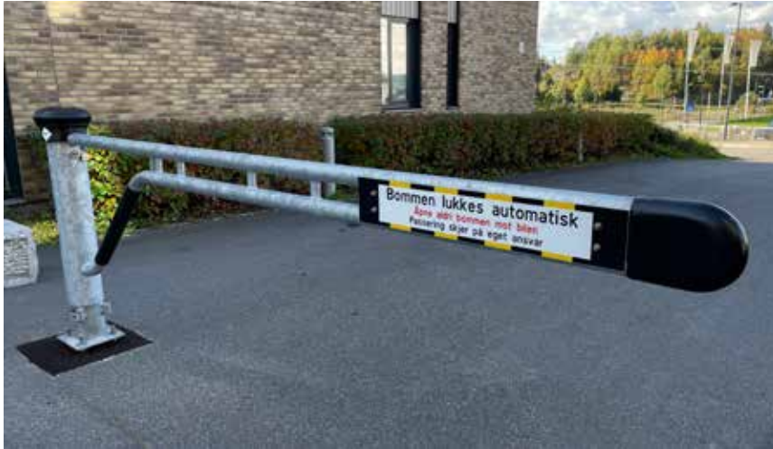
Autogate selvlukkende bom