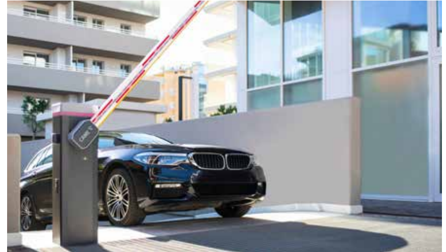
Came elektrisk bom