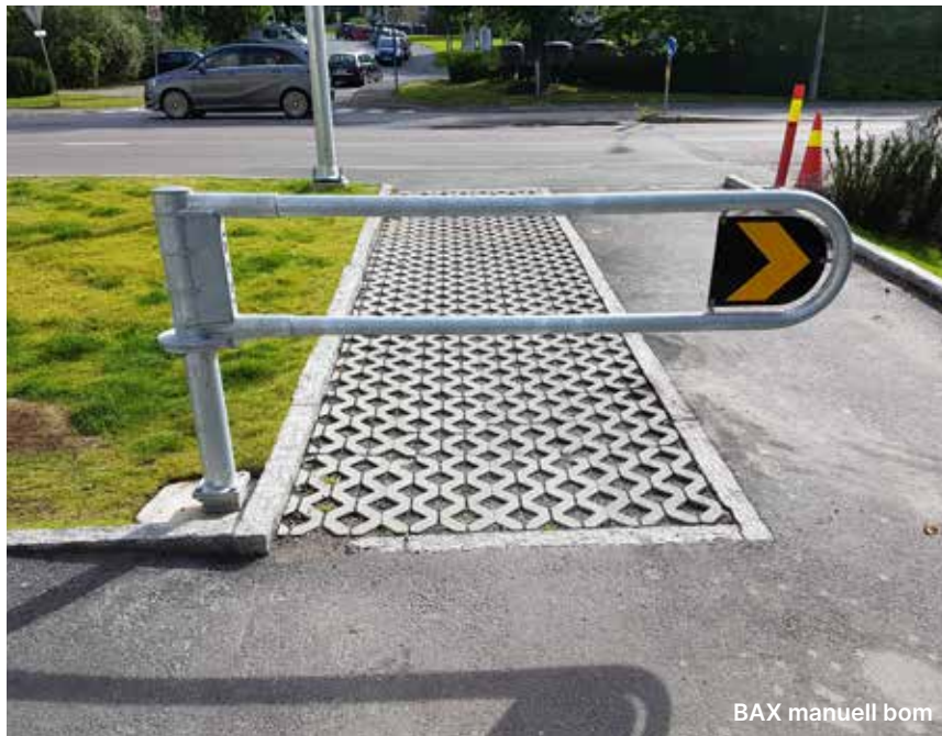
BAX manuell bom