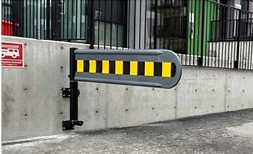
BIR selvlukkende bom