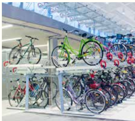
Easylift Premium DIN 500 sykkelparkering