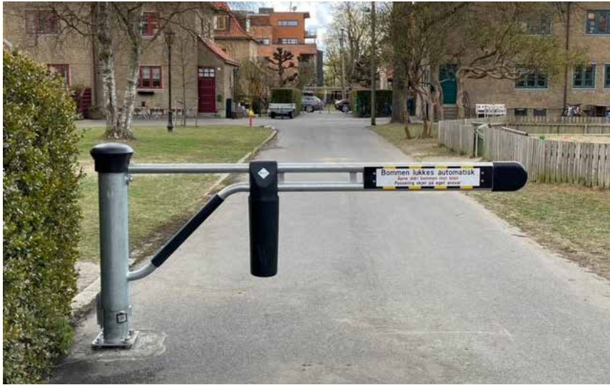
Autogate selvlukkende bom