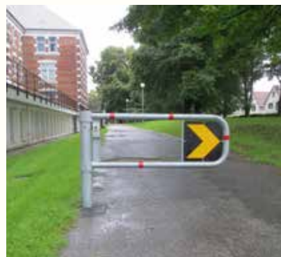
T&V manuell bom

Nøkkelen kan bare fjernes fra låsen når bommen er låst / lukket. Det sikrer omgivelsene.