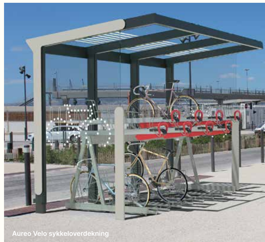
Aureo Velo sykkeloverdekning