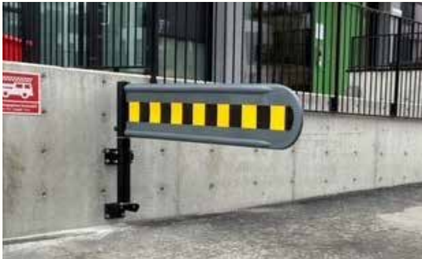
BIR selvlukkende bom