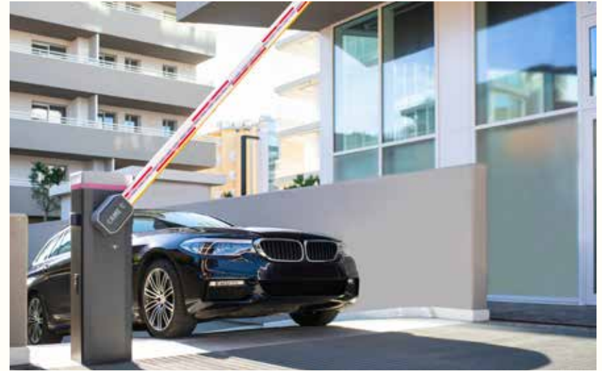
Came elektrisk bom