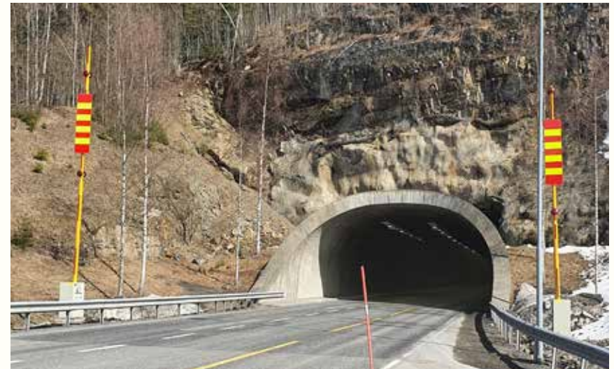
Rusthoven elektrisk bom